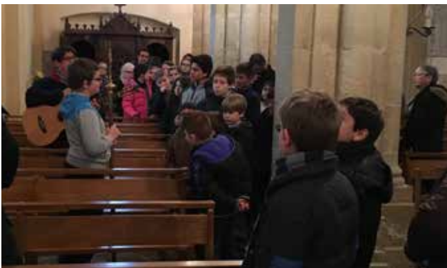
Chemin de croix à Gabriac.