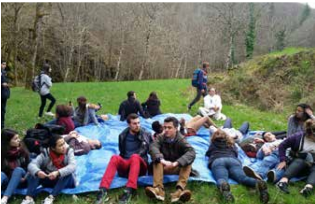
Rencontre des jeunes lycéens et JMJ à Conques.