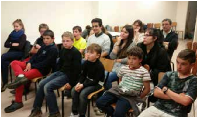
Soirée pizza et film sur le chemin de Saint-Jacques avec un groupe de jeunes.