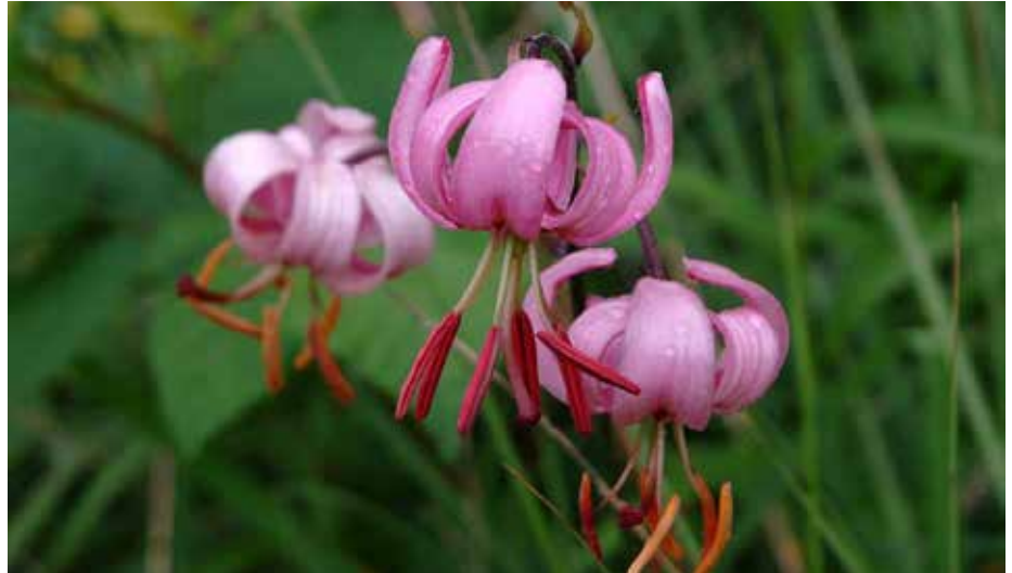
« Voyez le lis des champs, jamais Salomon, dans sa gloire, ne fut vêtu comme l'un d'eux.. » (évangile selon saint Mathieu)

Puis, aux merveilles de la floraison succéderont celles de la fructification, avec un foisonnement de baies rouges, bleues ou noires égayant haies et arbustes à l'arrière-saison, avec encore des trésors d'ingéniosité pour disperser graines, noyaux ou pépins loin de la plante qui les a vus naître.