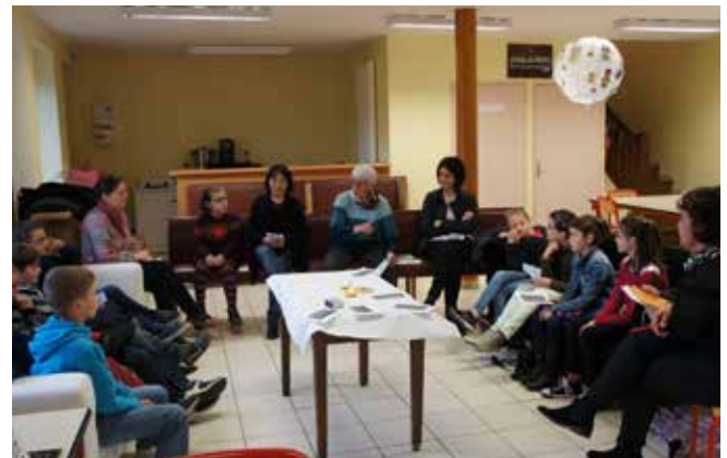
Témoignage pour les futurs communicants.

AVEYRON POMPES FUNEBRES ROUX Henri SPINELLI & Lionel DIAZ