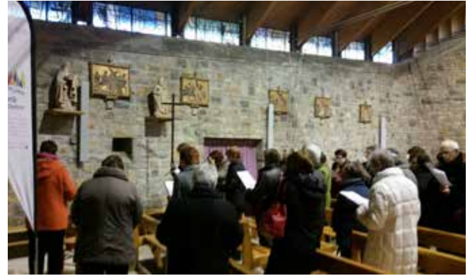
Chemin de croix sauvé de la déchèterie et installé dans l'église Saint-Pie X pour le vendredi saint.