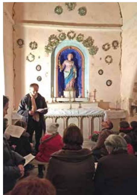
Soirée de prière à Sainte-Catherine