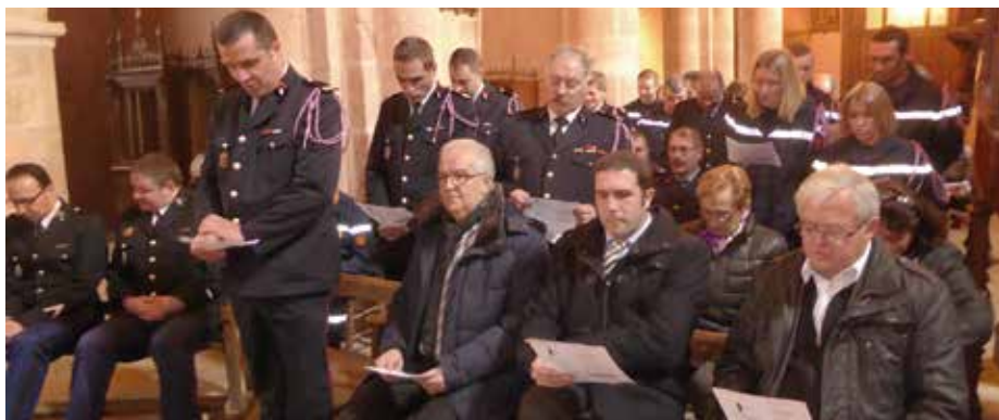
Les pompiers fêtent la Sainte-Barbe