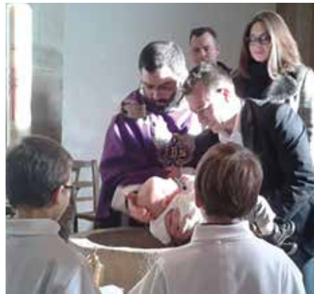
Baptême lors de la messe de saint Nicolas à Bezannes