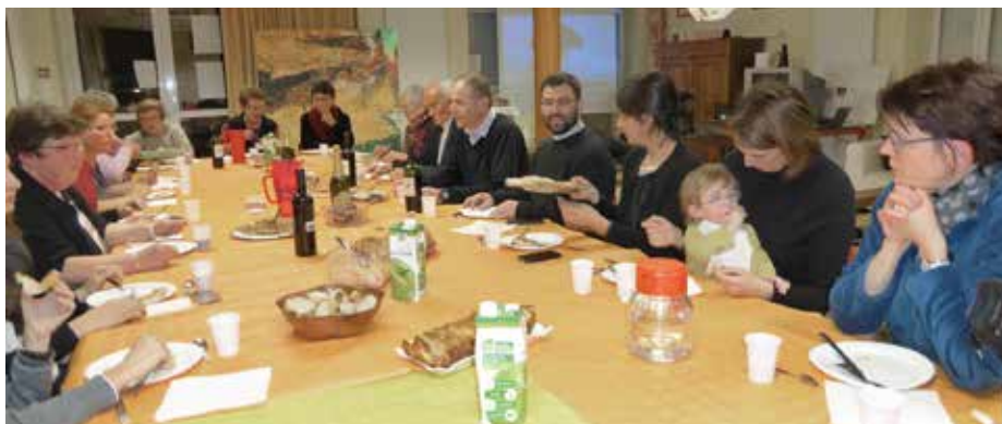
Rencontre fraternelle du 30 janvier 2016.