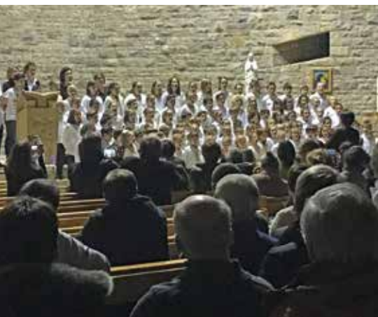
Concert des enfants de Saint-François